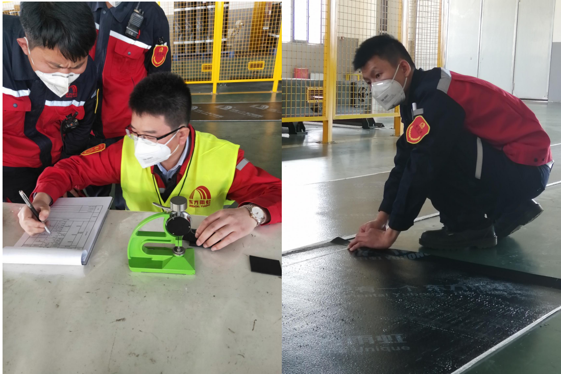
图 1 河南东方雨虹技术比武照片

东方雨虹建立“首席质量官管理制度”，确保产品质量责任的落实。严格实施岗位质量规范与质量考核制度，实行质量安全“一票否决”。执行重大质量事故报告及应急处理制度，健全产品质量追溯体系，切实履行质量责任与法定义务，依法承担质量损失赔偿责任。公司设立首席质量官，明确了其职责和权限，确保公司产品按照规定的产品规范和程序进行生产、检验、记录。质量责任制的落实，增强了各级领导和广大员工的质量意识，对工作质量和产品质量起到显著的推动作用。为了切实把质量责任制落到实处，公司制定了相应的质量奖惩措施严格考核并奖惩分明，使质量责任制持久地执行下去。