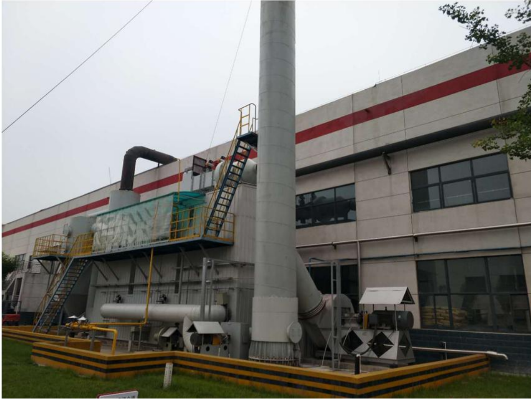
图 2 RTO 烟气处理环保装置

东方雨虹不仅在生产中践行节能减排之理念，在日常的办公及生活中，公司亦是绿色行动的倡导者和实践者。公司积极推行无纸化办公、完善车辆管理制度、合理用水等措施，实现了日常办公的绿色形象。